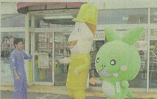
①クリーニングをされるブリカツくん(クリーニングチャム提供) ②クリーニング店を訪れたレルヒさんとササタマコ(新潟市西区)

クリーニングは県のキャラクターの「レルヒさん」や、佐渡市の「ブリカツくん」などが早速利用した。 きれいになったレルヒさんは、エヌキャラネットを通じて「コノきゃら専用くりーんぐトすふれーど、身毛心毛すつきりヤデー」とのコモントを寄せた。